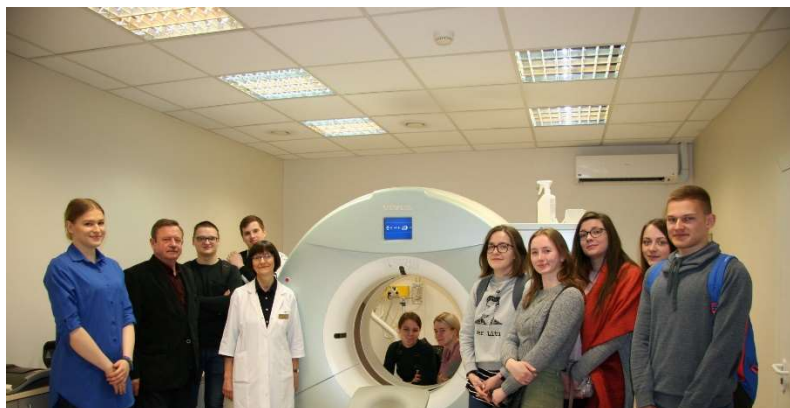
Vilniaus Gedimino technikos universiteto studentų ekskursija, 2018 m.

Edukuojame ir dalinamės žiniomis: periodiškai publikuojame mūsų gydytojų ir specialistų parengtus komentarus ir straipsnius įvairiomis sveikatos temomis, bendradarbiaujame su universitetų lektorais ir organizuojame ekskursijas – dukart per metus mūsų Centre lankosi Vilniaus Gedimino technikos universiteto biomechanikos studijų studentai, kuriuos supažindiname su radiologijos, oftalmologijos, kardiologijos ir kitose srityse taikomomis pažangiomis technologijomis.