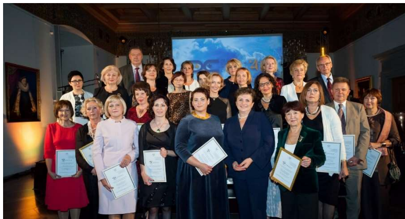
Medicinos diagnostikos ir gydymo centro 20 veiklos metų jubiliejus, 2015 m.

Tų pačių metų rudenį Centras švenčia 20 veikos metų jubiliejų. Ta proga išleidžiama Centro pasiekimus pristatanti knyga.