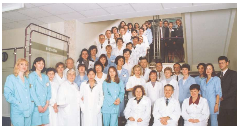
Medicinos diagnostikos ir gydymo centro kolektyvas, 1995 m.

Pradėjus veiklą, Centre konsultavo ir gydė 20-ies medicinos specialybių gydytojai, buvo atliekama apie 200 laboratorinių tyrimų. Tais pačiais metais Medicinos diagnostikos ir gydymo centras pirmasis Lietuvoje įsigijo kompiuterinį tomografą, kuriuo ilgą laiką buvo atliekami tyrimai visos Lietuvos gyventojams.