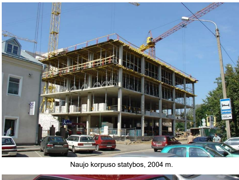
Naujo korpuso statybos, 2004 m.

Naujajame korpuse taip pat įkurti Alergologijos, Dietologijos, Fizinės medicinos ir reabilitacijos, Oftalmologijos, Ortopedijos traumatologijos ir Radiologijos centrai, gydytojų specialistų konsultaciniai ir diagnostiniai-tiriamieji kabinetai.